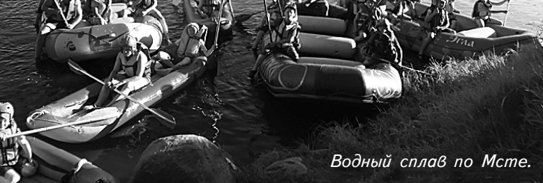
Водный сплав по Мсте.