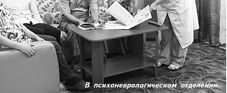
В психоневрологическом отделении.