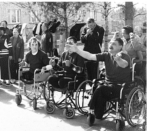
...ий день в интернате.